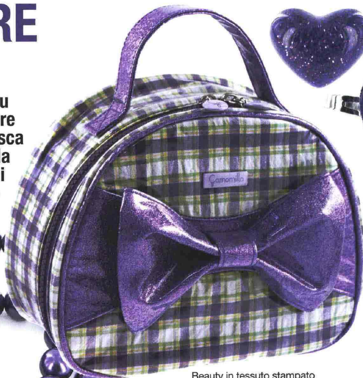
Beauty in tessuto stampato madras con manico e decorazione in vernice glitter.

Da solo, declinato su cuori e fiocchi, oppure accostato alla più fresca fantasia madras: è la nuova tentazione di Camomilla Milano