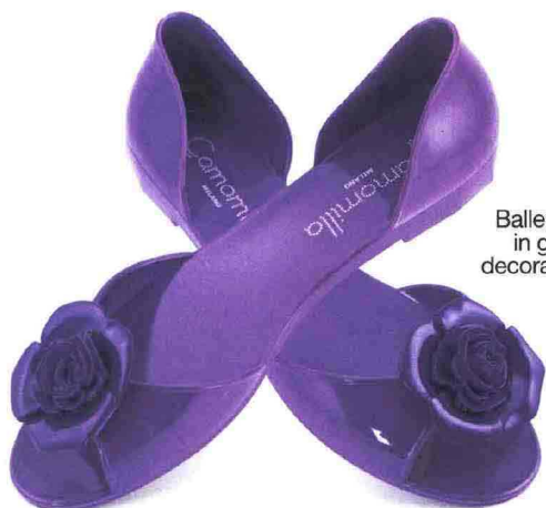
Ballerine spuntate in gomma con decorazione floreale.