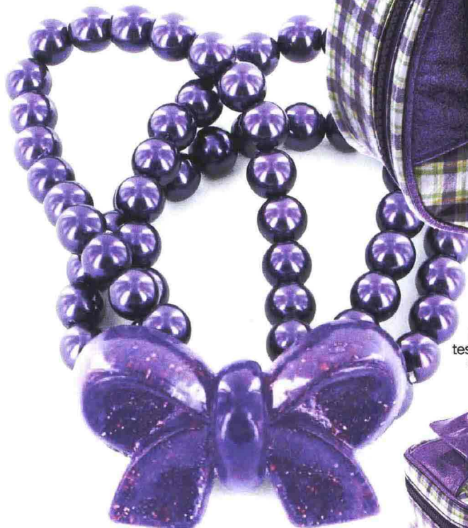
Bracciale a triplo filo di perle colorate con fiocco glitter.