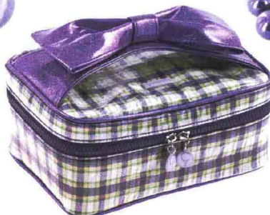
Beauty porta-tutto in tessuto stampato madras con manico a fiocco.