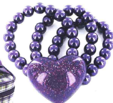
Bracciale a tre fili di perle colorate con cuore glitter.

www.camomilla.it / infofranchising@camomilla.it